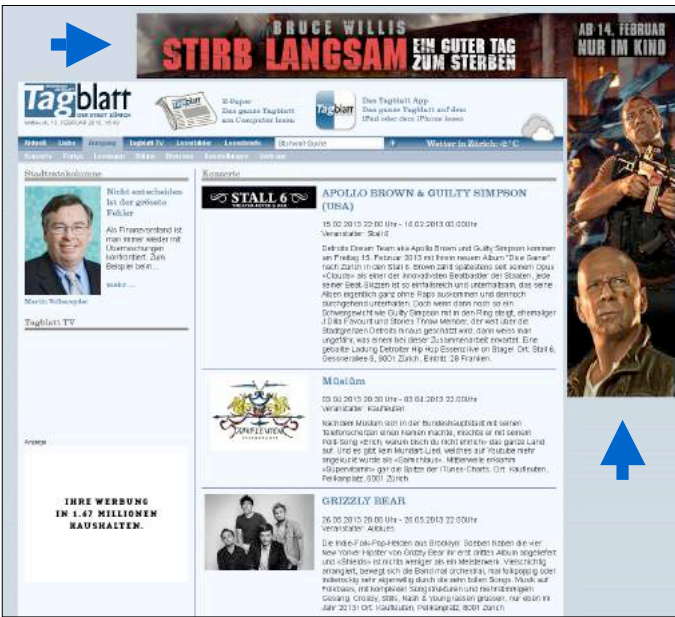
Wallpaper A (Skyscraper stösst von unten an das Maxiboard)